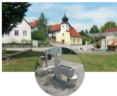
Waldenstein - Gradieranlage, Wasserretten, Armbecken, Barfußparcours